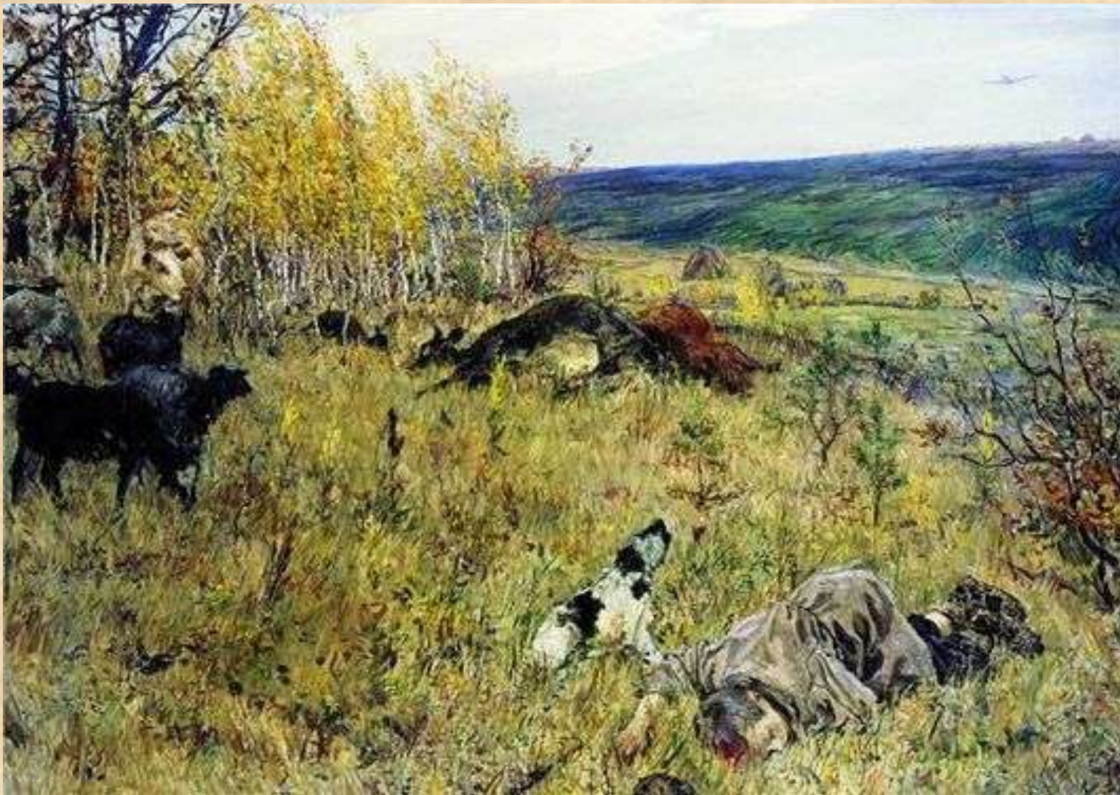
А. Пластов. Фашист пролетел. 1942г.