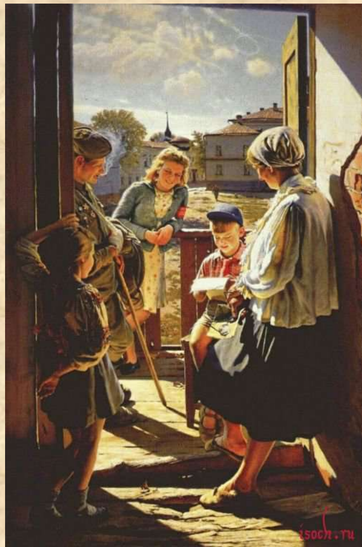
«Письмо с фронта»